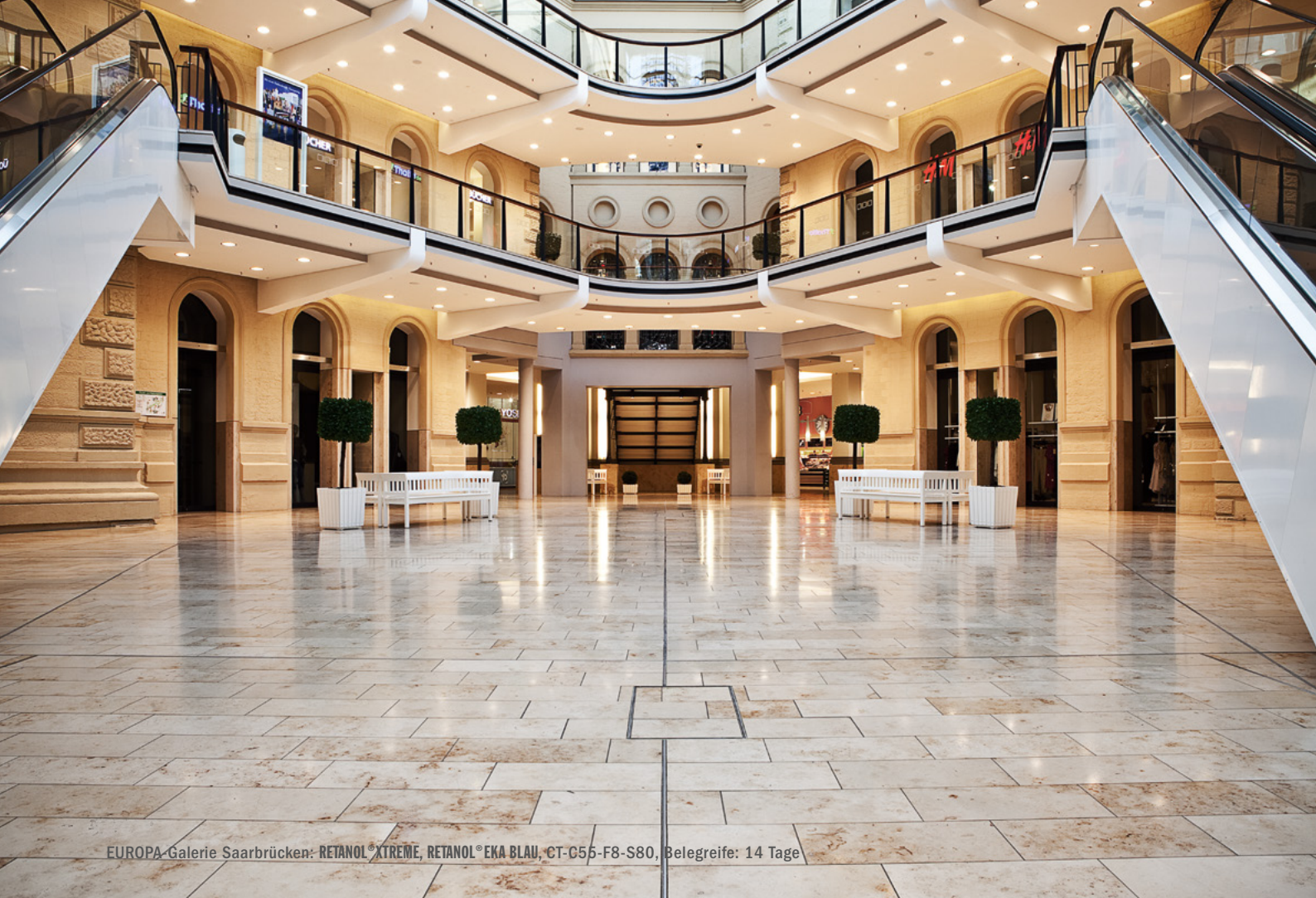
EUROPA-Galerie Saarbrücken: RETANOL® XTREME, RETANOL® EKA BLAU, CT-C55-F8-S80, Belegreife: 14 Tage

Für die Ausführung und Herstellung von Retanol® Estrichen gelten die allgemeinen Richtlinien, PCT Merkblätter und die normativen Vorgaben für Zementestriche. Die beschleunigte Erhärtung von Retanol® 511 und Retanol® EKA/EKA BLAU/EKA BW/EKA PRO/VIWA/VIWA GELB ist zu beachten.