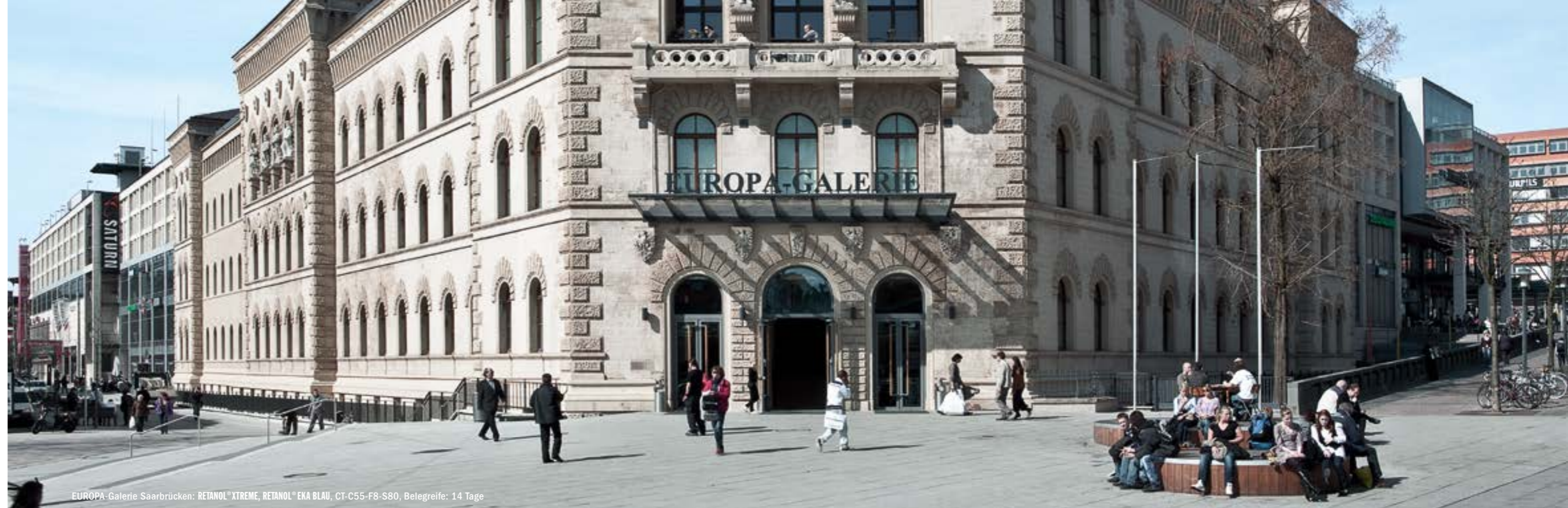
EUROPA-Galerie Saarbrücken: RETANOL® XTREME, RETANOL® EKA BLAU, CT-C55-F8-S80, Belegreife: 14 Tage